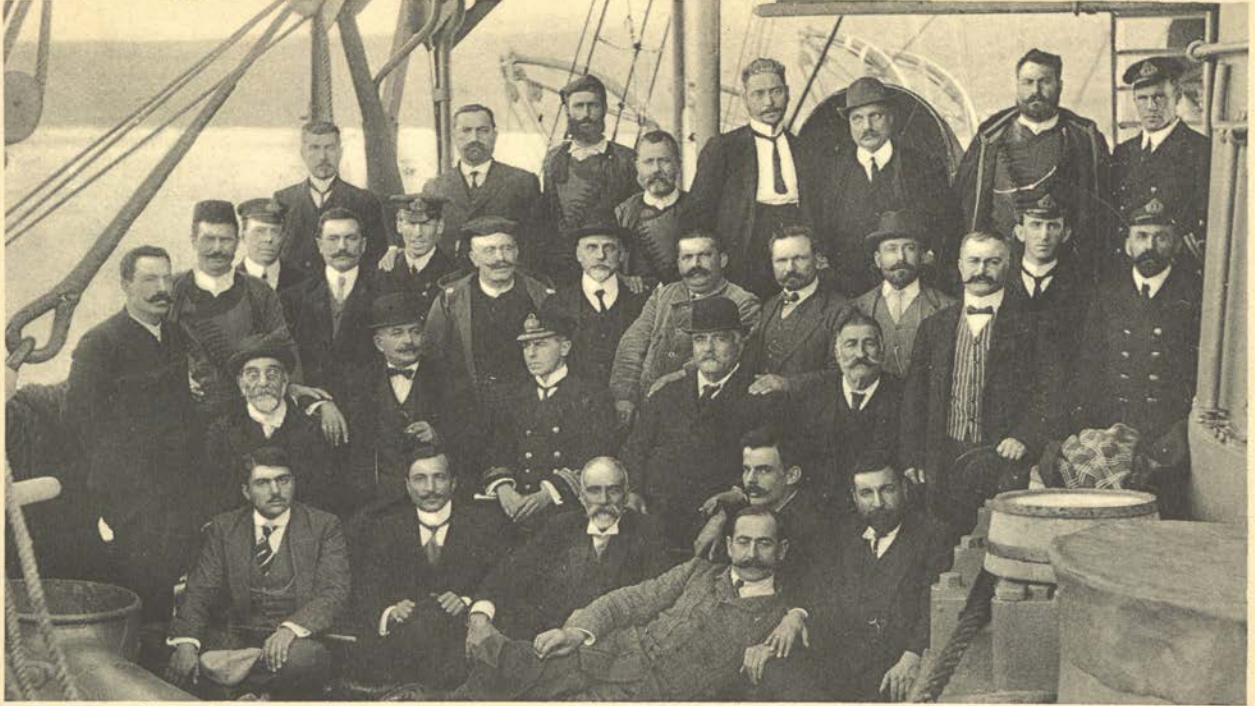
Les Deputés Crètois gardés sur les vapeurs de guerre Européens en 1911,