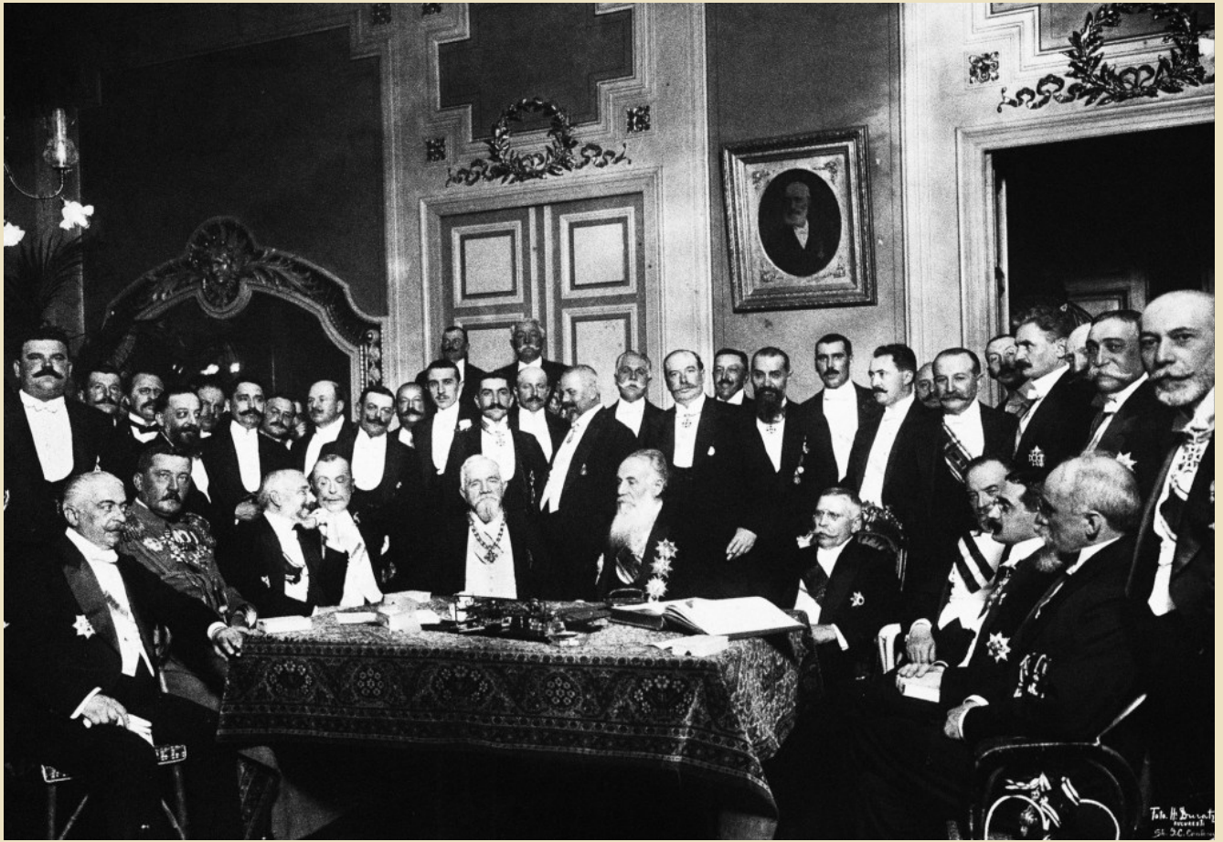
Ο Ελευθέριος Βενιζέλος, οι ηγέτες και οι αντιπροσωπείες των βαλκανικών κρατών τη στιγμή της υπογραφής της Συνθήκης του Βουκουρεστίου, 1913