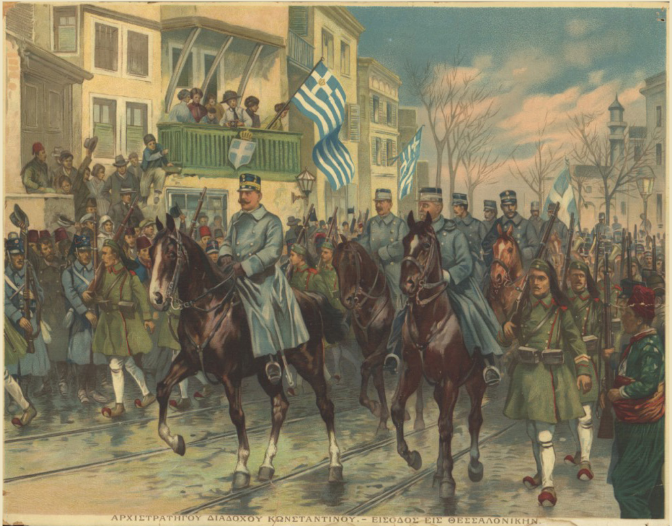
Η είσοδος του διαδόχου Κωνσταντίνου στη Θεσσαλονίκη, 26 Οκτωβρίου 1912