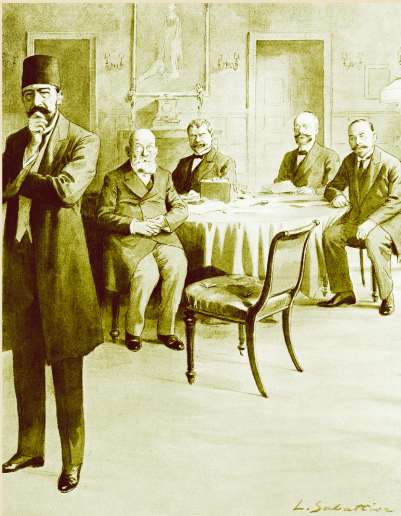
Διάσκεψη Ειρήνης στο Λονδίνο τον Δεκέμβριο του 1912. Διακρίνονται, από αριστερά, οι Ρεσήτ Πασάς (όρθιος, Τουρκία), Στόγιαν Νοβάκοβιτς (Σερβία), Στόγιαν Ντάνεφ (Βουλγαρία), Ελευθέριος Βενιζέλος (Ελλάδα) και Λάζαρ Μιούσκοβιτς (Μαυροβούνιο), L'Illustration , 11 Ιανουαρίου 1913